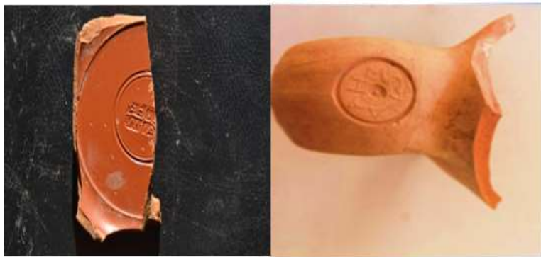
(صورة رقم ١٦) صورة توضح مقبض مختوم وجزء من إناء عليه نقوش من موقع الحفائر