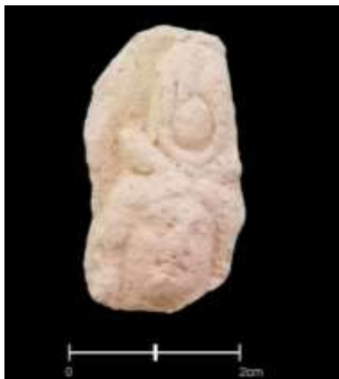
(صورة رقم ٣) صورة توضح المعبودة إيزيس من موقع الحفائر