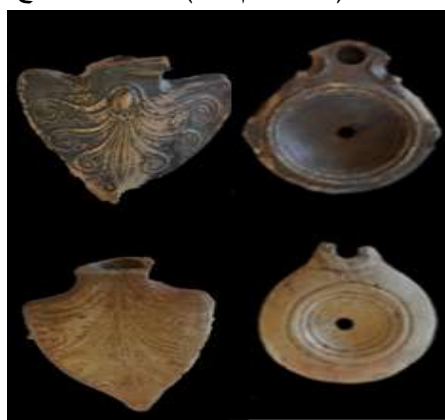
(صورة رقم ١٤)

صورة توضح المسارج ومقابض المسارج من موقع الحفائر