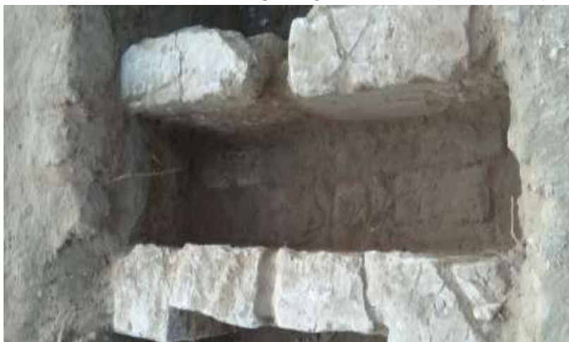
(صورة رقم ١١) صورة من الموقع توضح عقب باب وبجانبه أنبوب فخاري