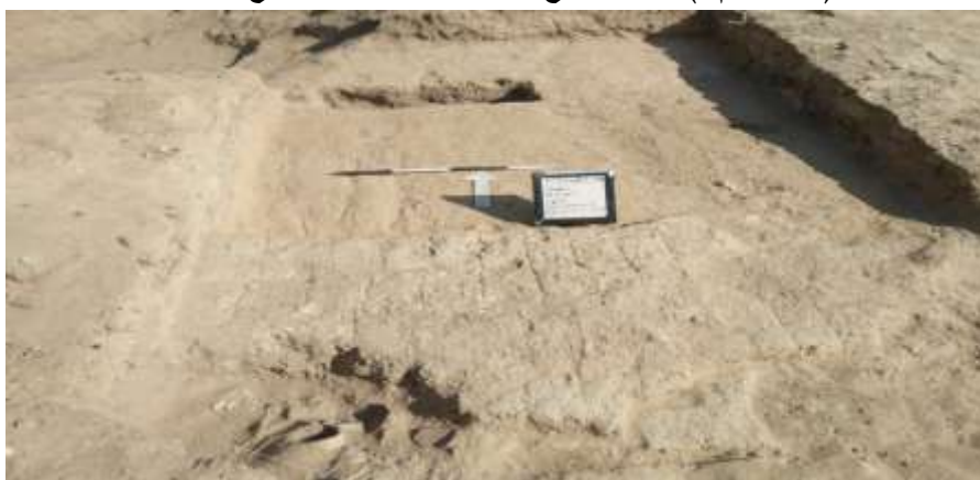
(صورة رقم ٤) صورة من الموقع توضح جدار من الطوب اللين