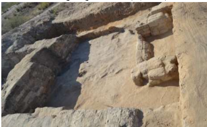
(صورة رقم ٧) صورة من موقع الحفائر توضح الفرن شبه مستطيل له تجويف في بطن الجدار و بروز داخل الحجرة