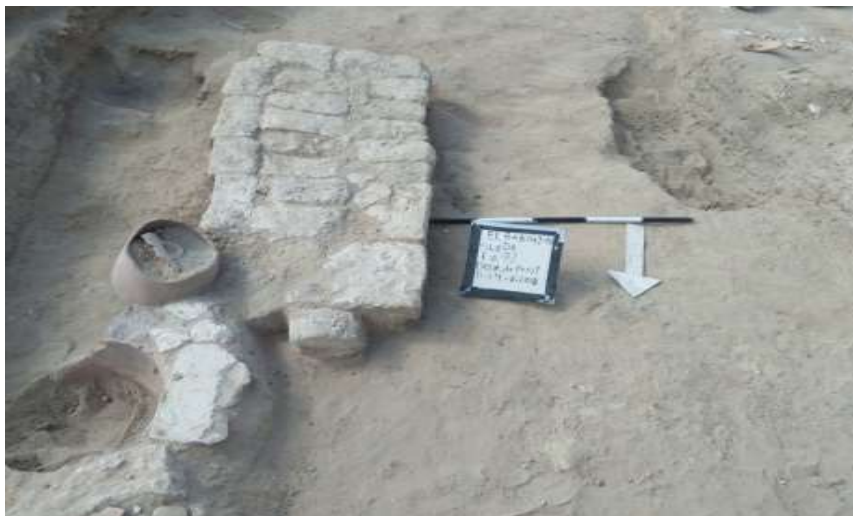
(صورة رقم ٩) صورة من الموقع توضح ممر من الحجر الجيري