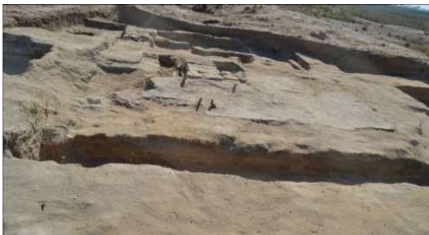
(صورة رقم ٨) صورة من الموقع توضح أرضية القصر وميل تصوير الباحثين