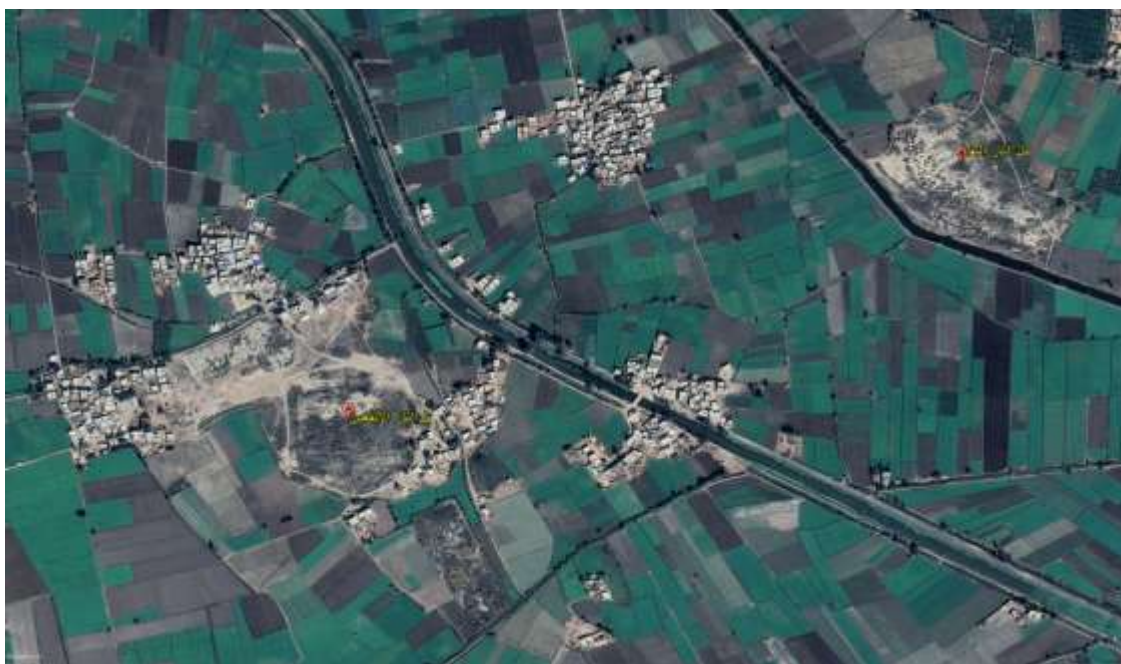
(صورة رقم ٢) خريطة بواسطة google earth لتل اثار البقرة والابقعين