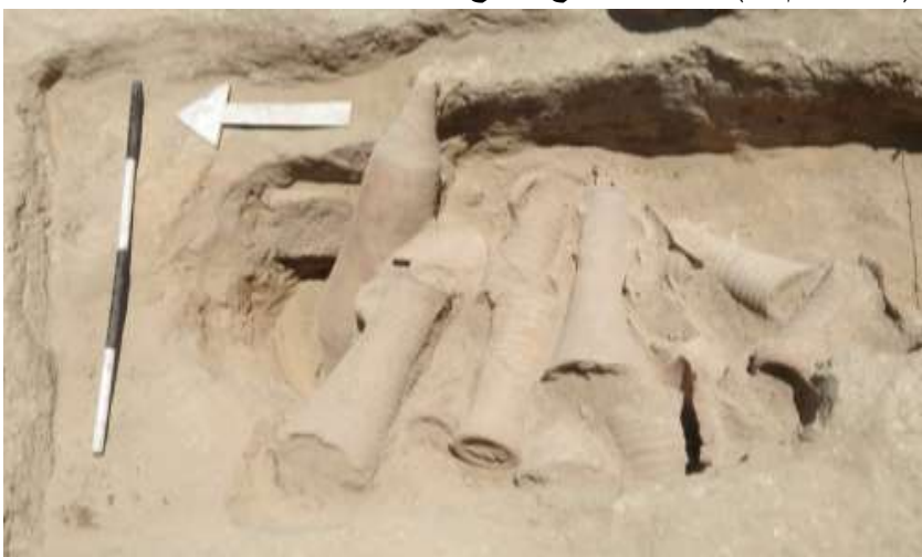
(صورة رقم ١٣) صورة من الموقع توضح مجموعة من الأمفورات