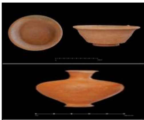
(صورة رقم ١٥)