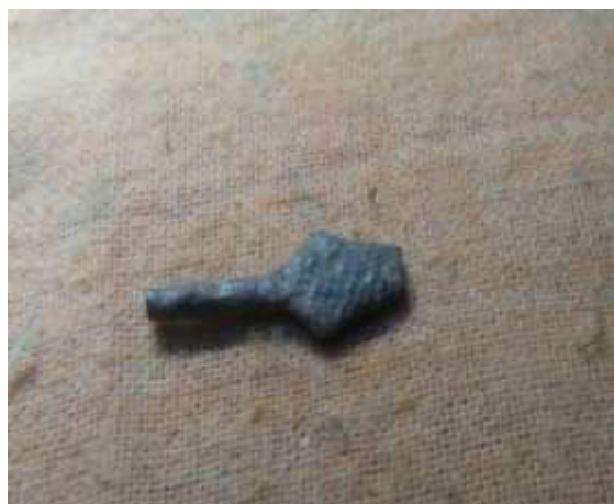
(صورة رقم ٢٠)

تصوير فوتوجرامترى للموقع بواسطة محمد عبد العزيز