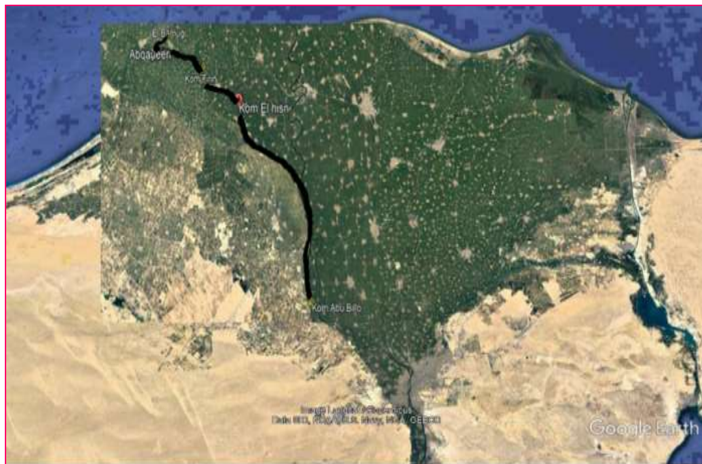
صورة رقم (١) خريطة بواسطة google earth لمواقع التحصينات العسكرية بغرب الدلتا