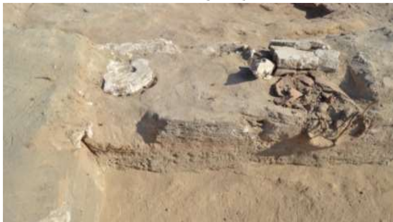
(صورة رقم ١٠) صورة من الموقع توضح عدة مداميك تشكل مصطبة تصوير الباحثين