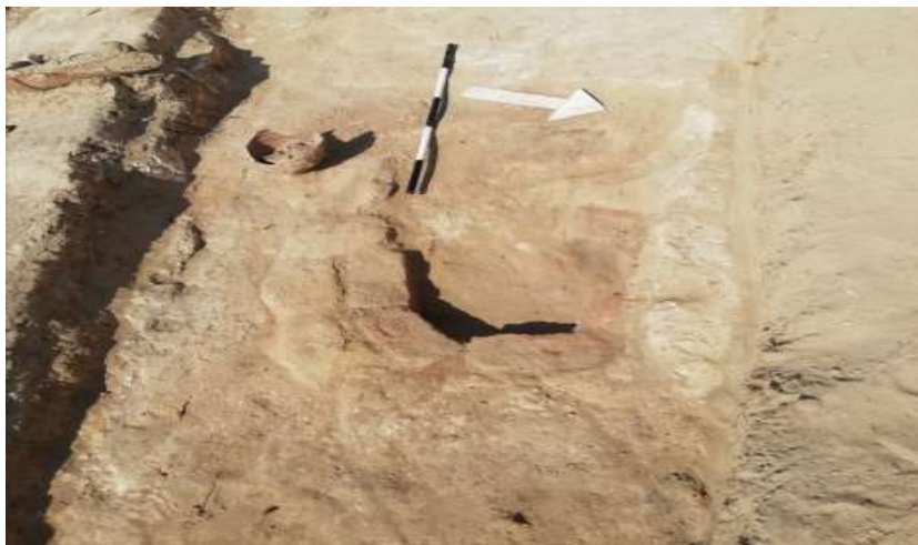
(صورة رقم ١٢) صورة من الموقع توضح فرن من الطوب الاحمر