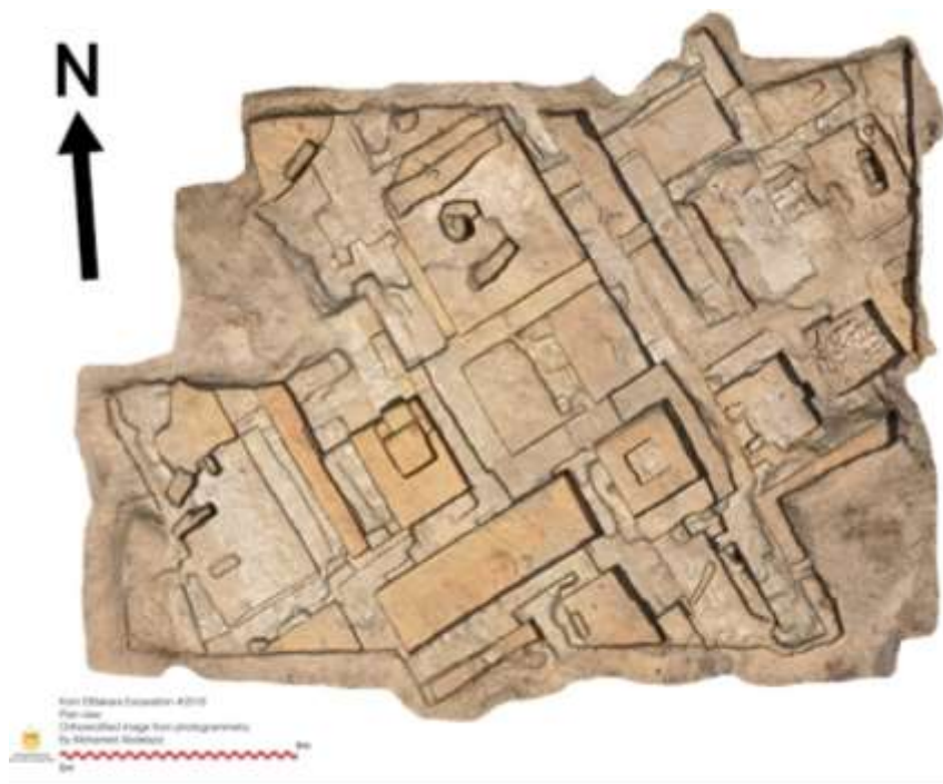
(صورة رقم ١٩)

تصوير فوتوجرامترى للموقع بواسطة محمد عبد العزيز