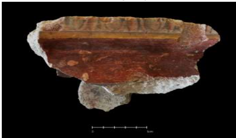
(صورة رقم ٥) قطعة من الملاط من موقع الحفائر