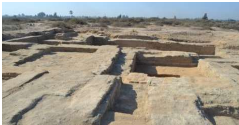
(صورة رقم ٦) صورة من الموقع توضح الجدران